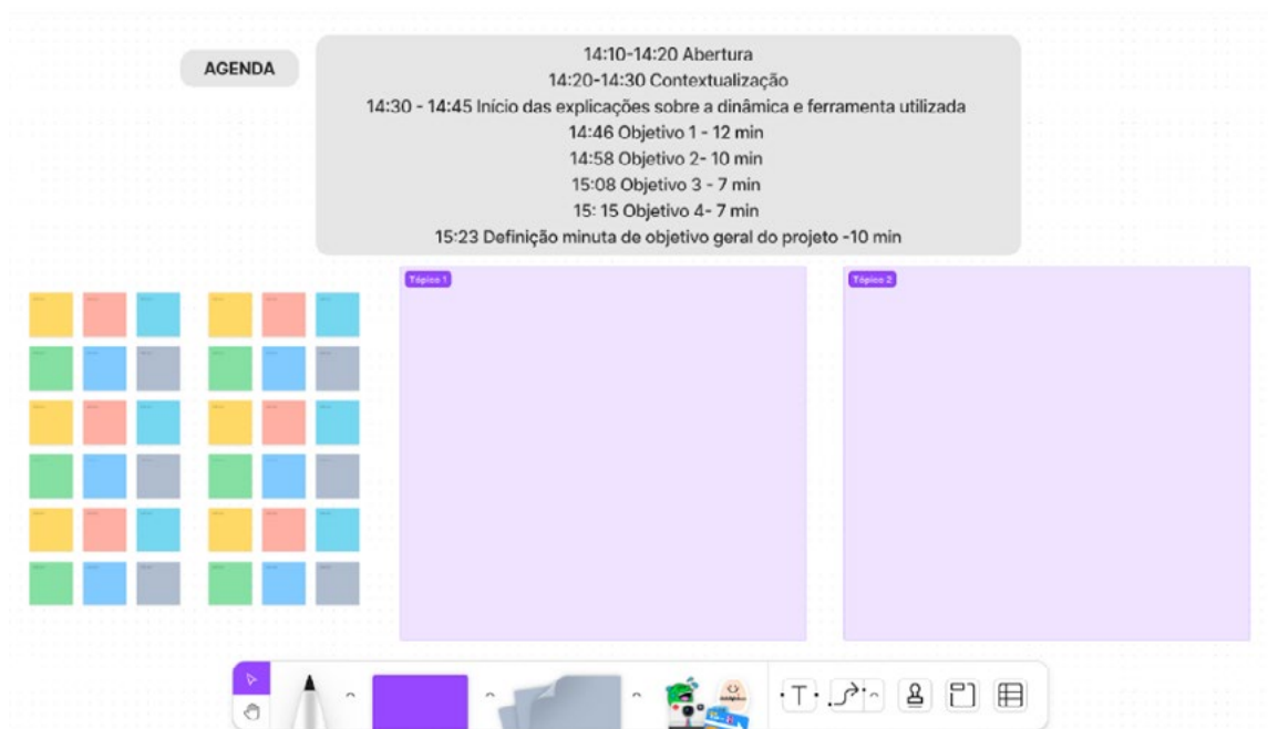
Figura 1 - Quadro colaborativo na ferramenta FigJam

As ferramentas interativas oferecem quadros brancos com diferentes configurações visuais e funcionais. Na etapa de preparação do quadro colaborativo, disponibilizam-se post-its para compartilhar ideias, espaços para organizar os post-its por tópicos predefinidos e outros elementos conforme necessário. Um exemplo de quadro básico está ilustrado na Figura 1.